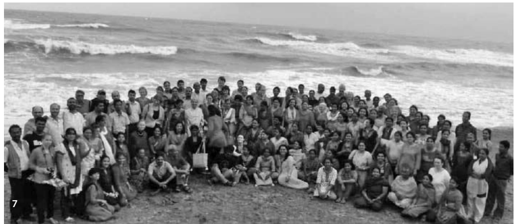
7 Foto de grupo del IPMT en la playa, India 2011