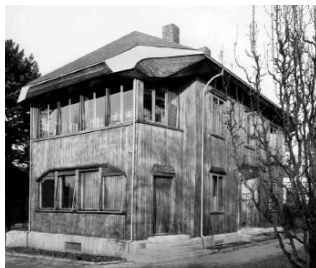
Ita Wegman Institut für anthroposophische Grundlagenforschung sekretariat@wegmaninstitut.ch www.wegmaninstitut.ch