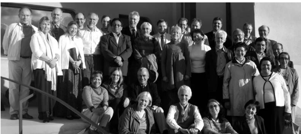
Junta de presidentes de las asociaciones nacionales de médicos antropósofos en Dornach