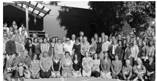
Fotos de la pág. 32 empezando por la parte superior izquierda: 1, 2 Curso de Psicología del IPMT en la Halde del Goetheanum, Suiza 2011,