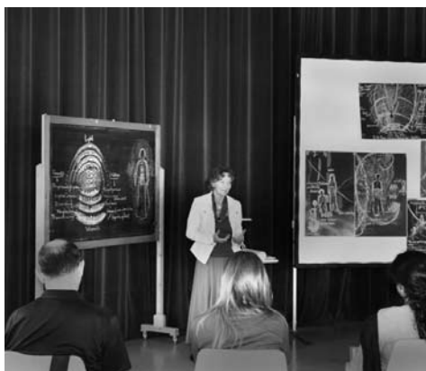
IPMT / International Postgraduate Medical Training in Dornach 2011