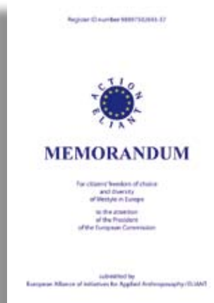
www.eliant.eu/new/userfiles/file/ pdf/Memorandum%20Allianz%20 ELIANT%202011.pdf

Fue una día significativo (ver página 43). El memorando redactado por los propios responsables con 15 peticiones concretas para establecer medidas jurídicas en la agricultura, alimentación, sanidad, educación, Pedagogía curativa e investigación está disponible solamente en inglés. Se está preparando la versión alemana. Me complace haber podido realizar el diseño, formato y la redacción de este documento. Heike Sommer